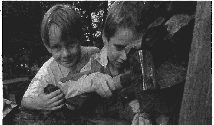
Die Aktionen des Vereins Abenteuerspielplatz sind bei Monheims Kindern offensichtlich beliebt.

Derweil stehen bereits die Pläne des Vereins Abenteuerspielplatz für 2008. Startschuss am dann wieder provisorischen Standort Rheinspielplatz an der Kapellenstraße ist wahrscheinlich